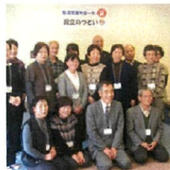
生活支援サポーター 絆

永源寺地区の『地域まるごとケア』の担い手、福祉や行政のサービスや制度では賅えきれない問題をサポート。市社協が実施した「生活支援サポーター養成講座」をメンバーが受講。支え切れていない困りごとが永源寺にもあること、その中には住民でもできることがあるなど、多くの気づきを元に「永源寺のために自分たちに何ができるか」を話し合い、2012年に結成 http://shigahochi.co.jp/info.php?type=article&id=A0014619文